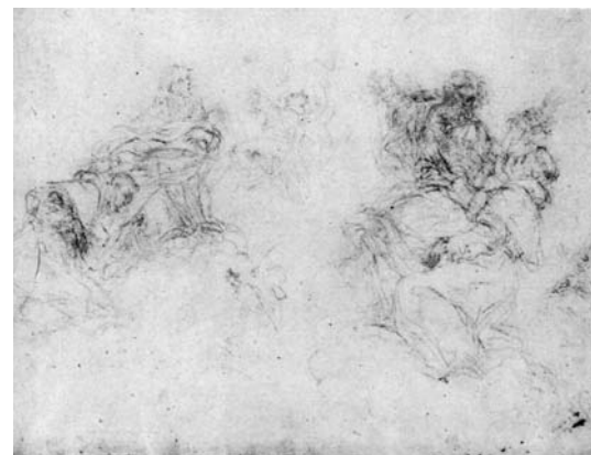
Baciccio, Schizzo con le figure di San Giacomo minore, San Francesco, San Filippo e Sant’Antonio da Padova. Düsseldorf, Museum Kunst Palast