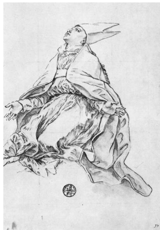
Baciccio, Studio definitivo per San Ludovico di Tolosa . Düsseldorf, Museum Kunst Palast

L'unico dipinto preparatorio che sino ad oggi era riemerso in relazione alla fase di progettazione della composizione, è il bozzetto reso noto nel 1977 dalla Canestro Chiovenda (cm. 156 x 76), ricomparso