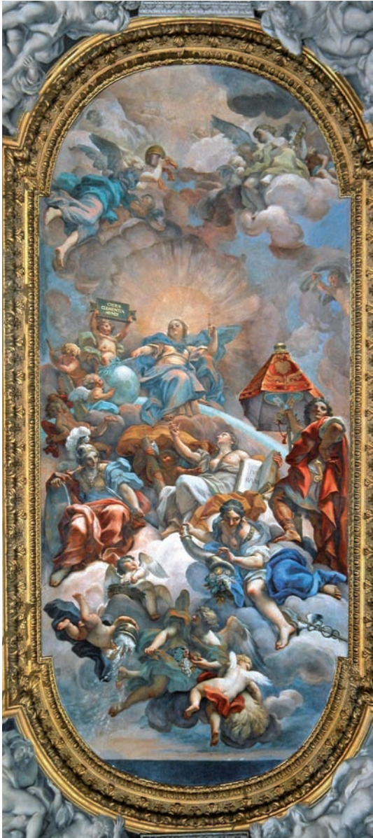
Carlo Maratta, La Divina Clemenza . Roma, Palazzo Altieri

salvifico della Grazia Divina, ha naturalmente un archetipo, anticipato dai vari “Teatri delle Quarantore”, nella Cathedra Petri realizzata da Bernini nella Basilica Vaticana (1657 – ’66).