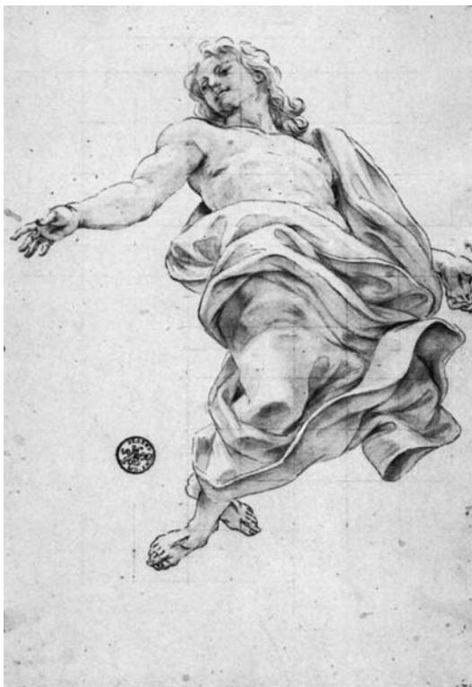
Baciccio, Studio definitivo per il Cristo . Düsseldorf, Museum Kunst Palast

Lione Pascoli ricorda che il pittore eseguì l'affresco in soli due mesi, all'età di 67 anni, accontentandosi dell'anticipo di 500 scudi: "...i padri di Santiapostoli l'impegnarono al lavoro della volta della loro chiesa, e vi seguì un fatto degno da rammentarsi. Imperocchè accordatosi per duemila scudi il prezzo, ed ito Gio: Batista, che cinquecento ricevuti ne aveva a conto, per stipulare il contratto, stipulato che fu, tirò fuori un foglio da lui sottoscritto, con cui donava alla chiesa il rimanente, e lo consegnò a' padri, che quivi erano capitolarmente congregati, che restarono a tale inaspettata generosità stupefatti. Corseglì tutti addosso ad abbracciarlo, chi lo prendeva da una parte, e chi lo tirava da un'altra, chi voleva ringraziarlo, e non poteva, perchè di giubilo gli cadevan dagli occhi le lagrime, chi gli dava mille benedizioni, e tutti uniti gli fecero tante finezze, e gli diedero tali segni di gradimento, e d'affetto, che l'ebbero a spremere co' baci. Misevi subito mano, nè mai ve la levò, finchè non l'ebbe finito; e fu tale l'applicazione di due mesi continui, che per compirlo v'impiegò, che non poco discapito ricevè nella salute".