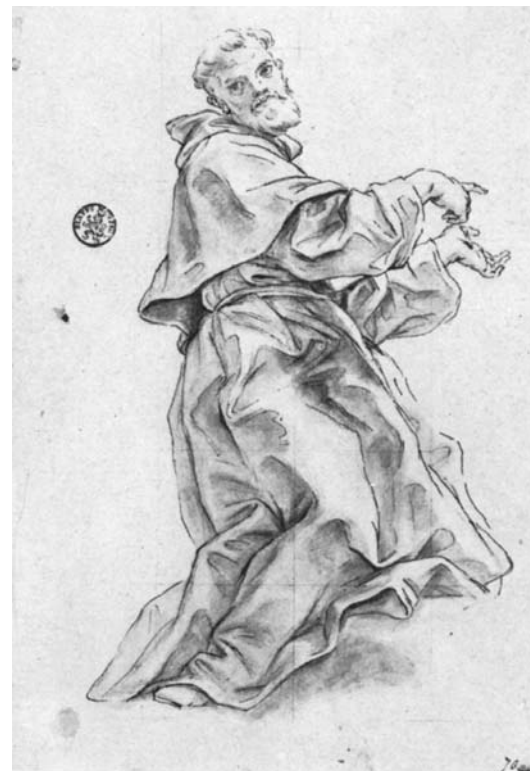
Baciccio, Studio definitivo per San Bernardino da Siena . Düsseldorf, Museum Kunst Palast

Tale tipo di decorazione illusionistica, incentrata sul motivo eucaristico da cui sprigionano raggi di luce che aprono le nubi investendo in un turbinio travolgente angeli e santi, visualizzazione del tema