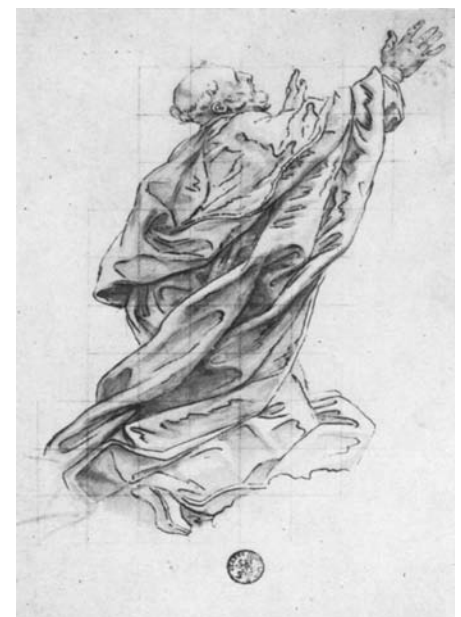
Baciccio, Studio per San Bonaventura (a sinistra) Düsseldorf, Museum Kunst Palast