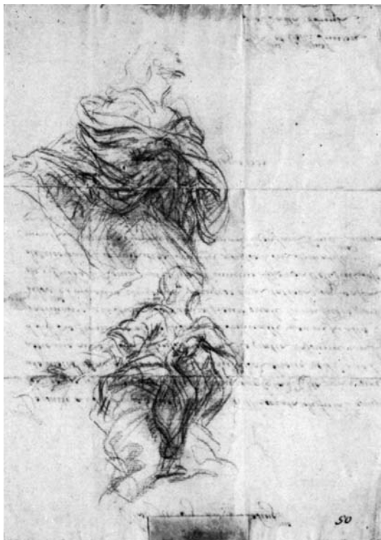
Baciccio, Studio per San Giacomo minore . Düsseldorf, Museum Kunst Palast