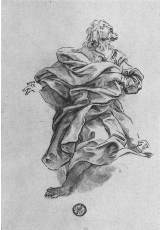
Baciccio, Studio per San Giacomo minore . Düsseldorf, Museum Kunst Palast