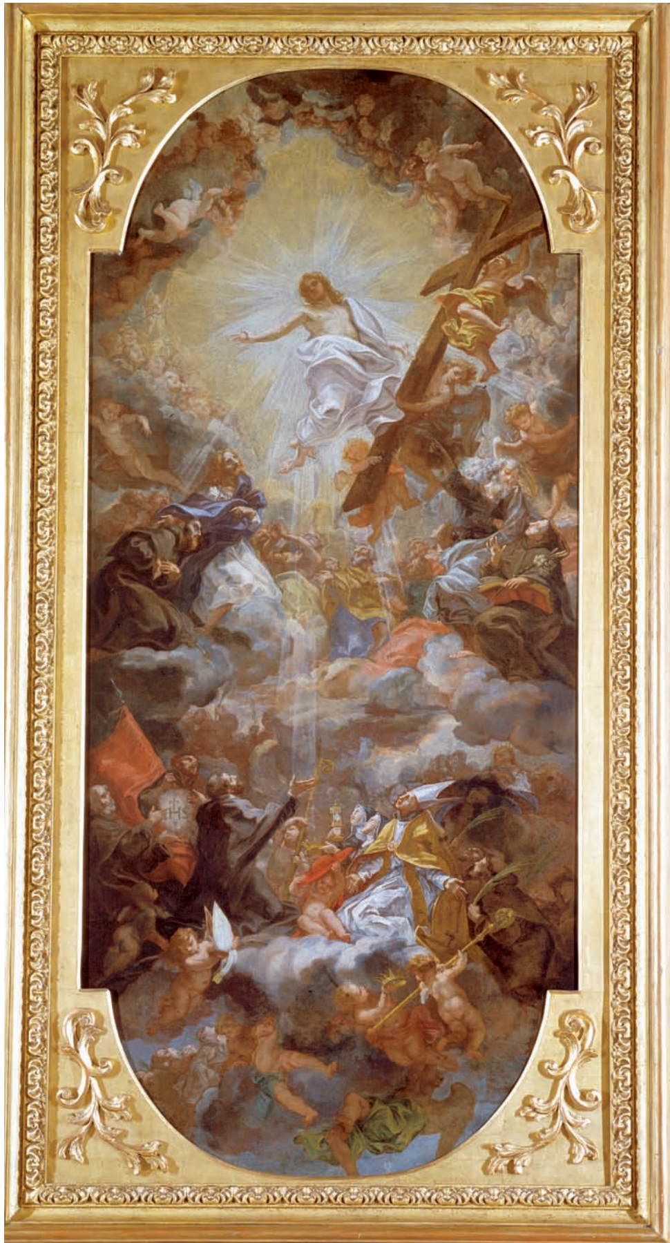
Baciccio, Cristo in gloria con apostoli e santi francescani . Genova, Collezione Zerbone