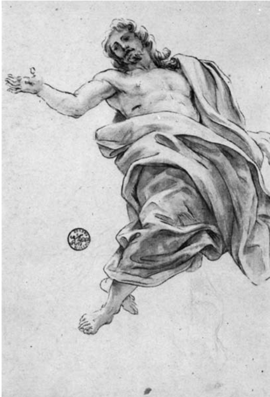
Baciccio, Studio per il Cristo . Düsseldorf, Museum Kunst Palast