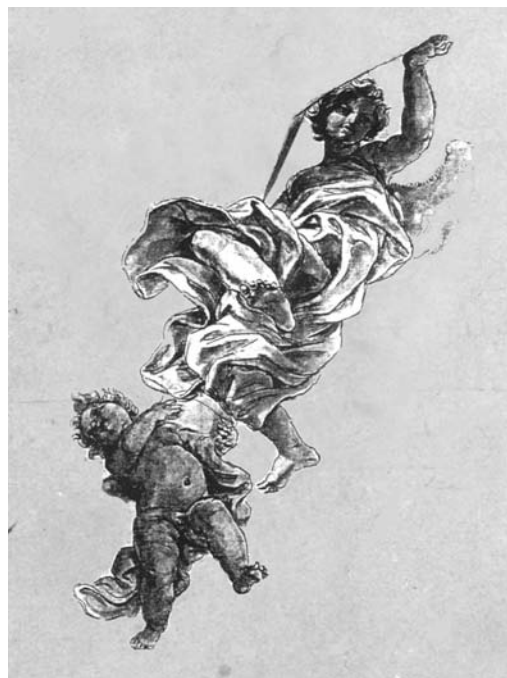
Baciccio, Studio per un angelo ed un putto con la croce . Oxford, Ashmolean Museum