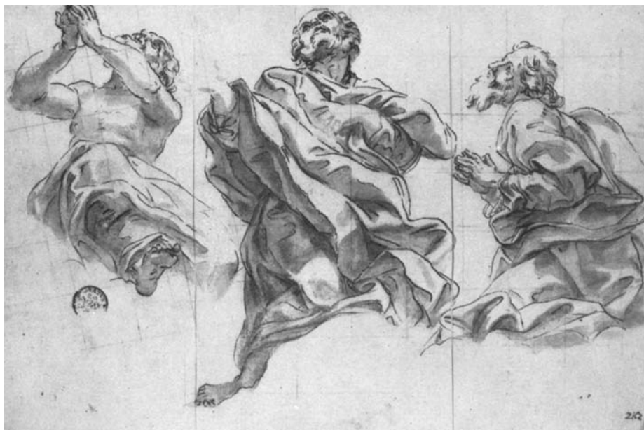
Baciccio, Studio definitivo per Sant'Andrea, San Pietro e San Paolo . Düsseldorf, Museum Kunst Palast

Ma quale poteva essere l'originaria provenienza del dipinto? Possiamo rilevare che secondo la documentazione archivistica e gli studi noti esistevano almeno tre tele in connessione con una fase preparatoria per l'affresco: il bozzetto donato dal Gaulli al cardinale Giorgio Cornaro; il dipinto presente nell'inventario ereditario di casa