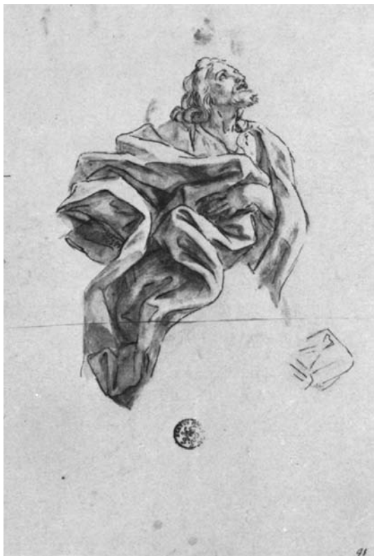
Baciccio, Studio per San Giacomo minore . Düsseldorf, Museum Kunst Palast

sceita ricadesse su Gaulli, che da più di vent'anni non riceveva un incarico pubblico a Roma, non può che farsi risalire all'intervento diretto del suo più fedele mecenate”.