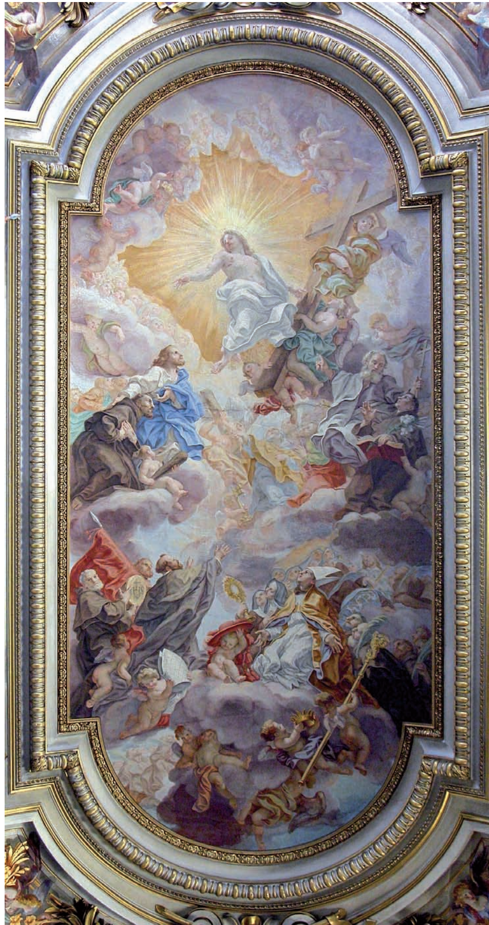
Baciccio, Cristo in gloria con apostoli e santi francescani . Roma, Basilica dei Santi Apostoli