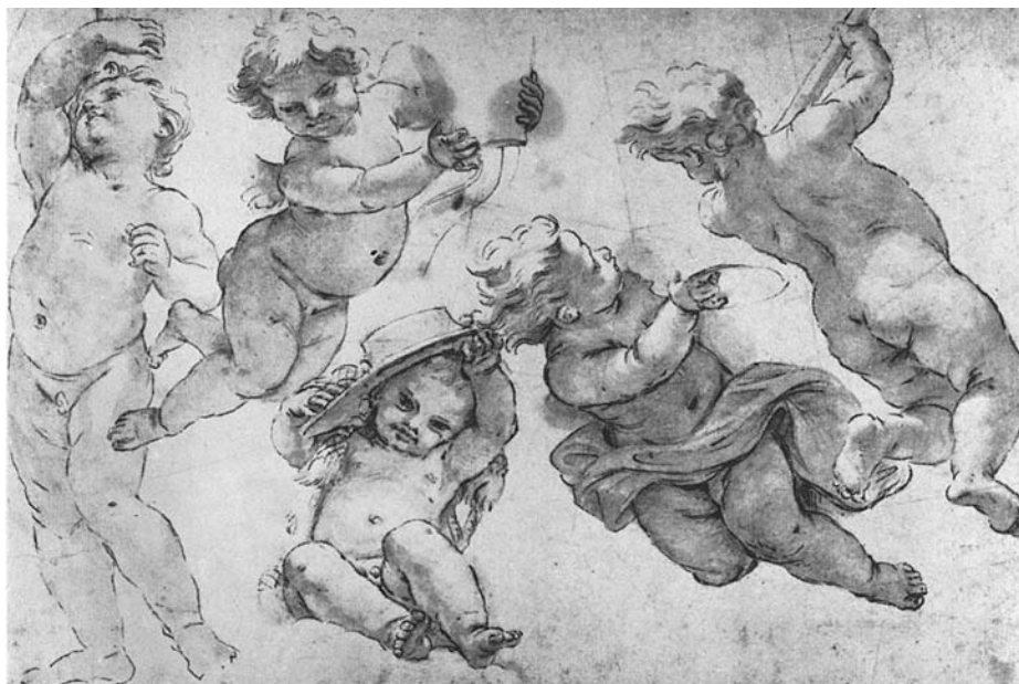
Baciccio, Studi per i vari putti presso la figura di San Ludovico . Già Londra, Sotheby's, 1977