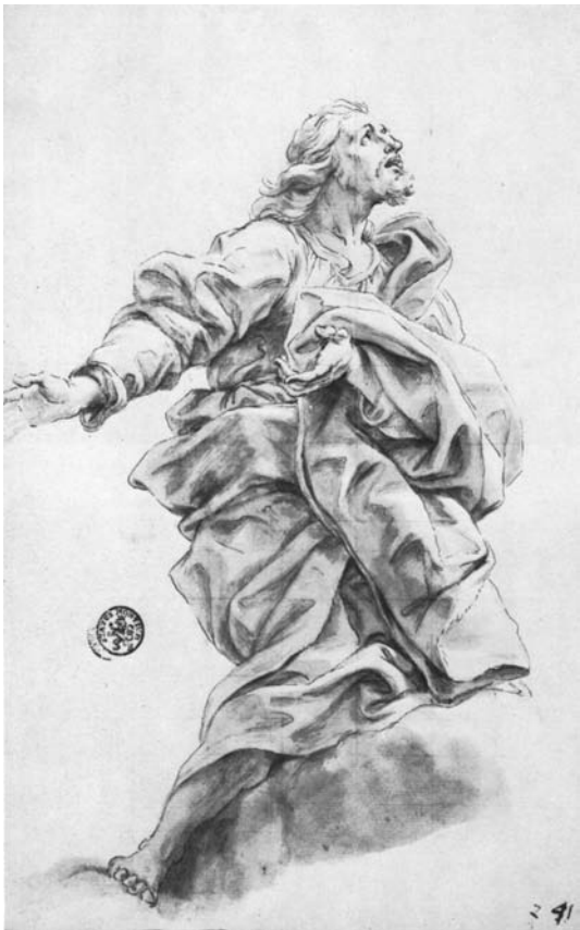
Baciccio, Studio definitivo per San Giacomo Minore . Düsseldorf, Museum Kunst Palast

Uniche varianti a livello formale che riscontriamo invece dal confronto tra il modello e l'affresco, riguardano l'eliminazione dell'angioletto che tiene il pastorale presso San Bonaventura (figura con le braccia protese verso la croce) - la cui presenza forzata tra il putto con il cappello cardinalizio e il santo avrebbe congestionato la zona centrale in basso, soffocandone la spazialità -, come pure la scomparsa dei monaci martiri sullo sfondo sopra la testa del santo. Di contro Baciccio ha ingrandito nell'affresco l'ostensorio dorato tenuto da Santa Chiara.