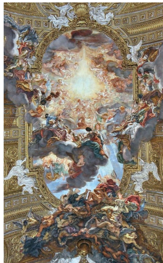
Baciccio, Trionfo del nome di Cristo . Roma, Il Gesù