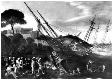
Fig. 17. Agostino Tassi, Scena di porto mediterraneo , c. 1623, olio su tela, cm 91,5x133. Francia, collezione privata.