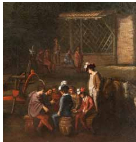
Fig. 11. particolare della Fig. 10.