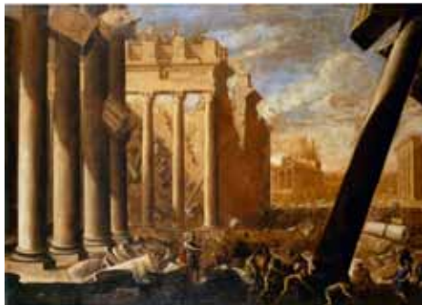
Fig. 24. Agostino Tassi, Terremoto in una città antica , c. 1635, olio su tela, cm 97x133. Milano, mercato antiquario.

Un Terremoto in una città antica , è ovviamente il riflesso della Peste di Azoth di Nicolas Poussin, che fu copiata da Angelo Caroselli per il nobile siciliano Fabrizio Valguarnera, dedito al traffico di diamanti e dipinti 43 (Fig. 24). Dato che il quadro di Poussin fu terminato nel 1631, quello del Tassi deve essere posteriore a questa data. Una Discesa di Proserpina agli inferi , di identiche dimensioni, rappresenta anch'essa edifici antichi che crollano, tema forse ispirato dal De Nomé. In questa bellissima e inquietante visione il baratro che si apre per inghiottire la fanciulla libera demoni dalle viscere della terra e distrugge un tempio (Fig. 25). Le figure femminili che ricordano ancora quelle del Caroselli e le pennellate veloci fanno propendere per una datazione tarda, dopo il 1635, anche se non è chiaro fino a che data il pittore, gravemente affetto da podagra, fosse in grado di dipingere. La rappresentazione infernale si adatta ai "capitali delitti" di cui il Tassi si rese colpevole secondo il Passeri. Furono profetiche le parole del biografo secondo il quale i comportamenti mostruosi del pittore avrebbero ben presto oscurato la sua fama. Persino negli inventari di palazzo Lancellotti ai Coronari, dove il Tassi aveva dipinto centinaia di metri quadrati, il suo nome venne presto sostituito da quello di Filippo Napoletano.