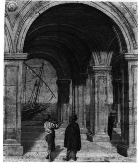
Fig. 2. Agostino Tassi, Veduta architettonica con paesaggio , 1603, olio su pietra, cm 10x8, ubicazione sconosciuta.

Del periodo precedente il suo definitivo ritorno a Roma è rimasto poco; sono quasi certamente sue sei tele del Museo Navale di Genova, di cui alcune tradiscono la mano di un collaboratore - sappiamo comunque che il cognato Filippo Franchini già lavorava insieme al Tassi sia a Genova che a Livorno. Tra quelle autografe ricordiamo ad esempio la Scena di porto di Livorno con cantiere e navi in demolizione 8 (Fig. 1). Federico Zeri attribuiva al Tassi, probabilmente a ragione, una Didone che costruisce Cartagine (ubicazione sconosciuta) e una Scena di città al Philadelphia Museum of Art, che lascia più perplessi. 9 Due minuscole vedute architettoniche su pietra, che sembrano quasi anticipare la Sala dei Palafrenieri di palazzo Lancellotti, potrebbero anch'esse fare parte della prima produzione del Tassi (Fig.