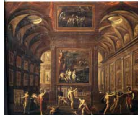
Fig. 20. Agostino Tassi, Galleria , c. 1638, olio su tela, cm. 73,5x99, 5. Prato, Museo Civico.

A parte i dipinti di tempeste marine, la maggiore parte delle opere del Tassi fino ai tardi anni Venti mostra sereni paesaggi, ben lontani dalle turbolenze della sua vita, ma con il passare degli anni il pittore si dedicò a scene più cupe, quasi infernali, come se la serie infinita di aggressioni e violenze subite e imposte avesse finalmente cominciato a comparire nelle sue tele. Chiarito il suo percorso negli anni Trenta, nuove tele di questa fase continuano ad apparire sul mercato antiquario, soprattutto in Francia. Il Musée des Augustins a Tolosa ha di recente acquistato una grande Incendio di Troia , soggetto e composizione che ricordano il dipinto rappresentato nel registro superiore della Galleria a Prato. La tela di Tolosa è anche simile all' Incendio notturno di una città esposto nel 2008 e tanto le figure quanto le architetture sono ben riconoscibili come opera del pittore (Fig. 21). 40 I piccoli personaggi acquistano i tratti somatici di quelli del Caroselli, con cui il pittore collaborò almeno dal 1631 al 1635. 41 Una Fuga da Troia , dove si riconosce chiaramente Enea con Anchise sulle spalle, compare anche in una tela della Galerie Canesso, che è probabilmente appena più tarda, e che è il pendant di un interessantissimo Cantiere navale , di squisita fattura, che sembra anticipare le Prigioni di Piranesi. 42 Il