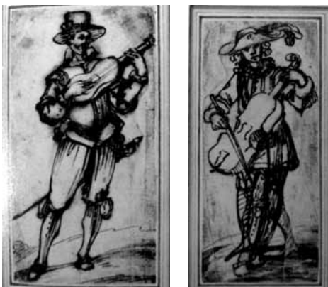
Fig. 12. Agostino Tassi, Musicanti , 1616, penna e inchiostro acquarellato su carta, cm 11,4x6,3. Londra, Victoria and Albert Museum.