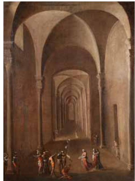
Fig. 16 Agostino Tassi, Decollazione di San Giovanni Battista , 1625-26, olio su tela, cm 72x51, Roma, collezione privata.