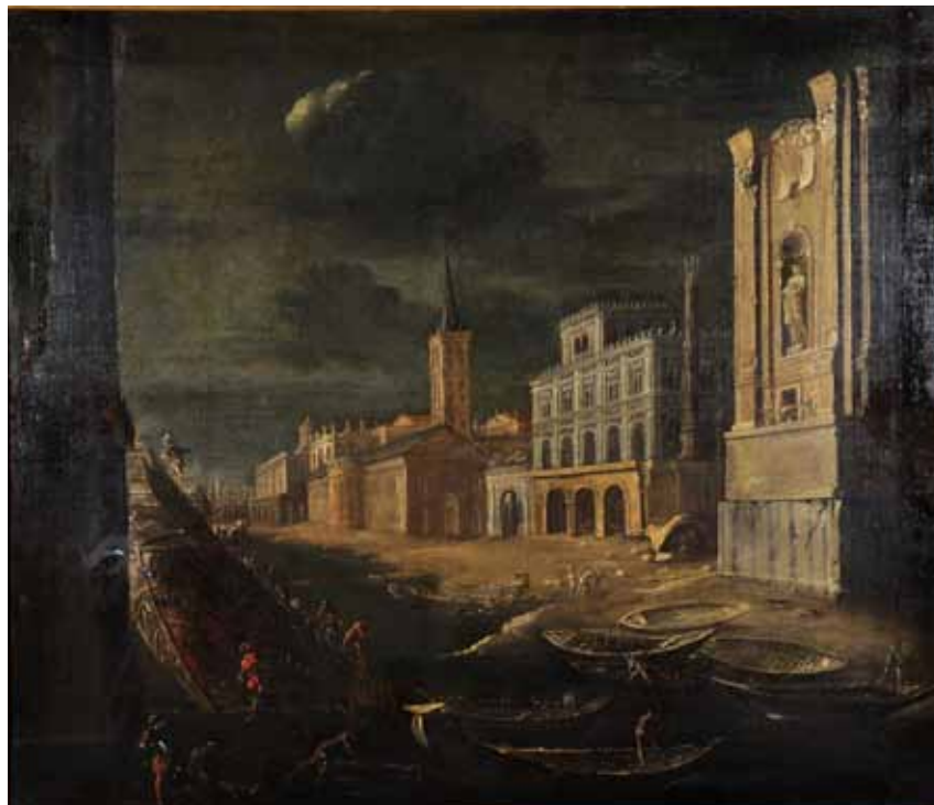
Fig. 19. Agostino Tassi, Capriccio architettonico con porto mediterraneo , 1629-30, olio su tela, cm. 95,5x110,5. Inghilterra, collezione privata.