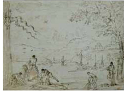
Fig. 14. Agostino Tassi, Veduta costiera con pescatori , 1622, penna su carta, cm 22,8x17,5. Berlino, Kupferstichkabinett.