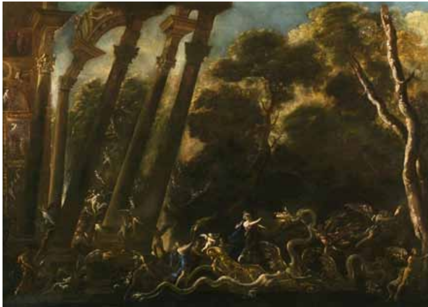
Fig. 25. Agostino Tassi, Discesa di Proserpina agli inferi , c. 1638, olio su tela, cm 97x133. Parigi, mercato antiquario.

tema dei cantieri navali, a volte ambientati in luoghi di sfrenata fantasia, venne spesso ripetuto dal pittore, che ben li conosceva dal suo lungo soggiorno livornese. (Fig. 22-23)