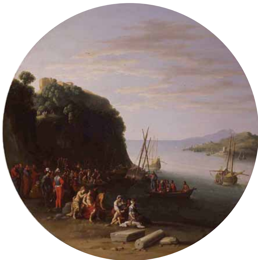
Fig. 6. Agostino Tassi, Chiamata di Simon Pietro , c. 1613, olio su tavola, diam. cm 58,5. Parigi, Galerie Canesso.

tileschi e successivamente di una rissa, fu esiliato a Bagnaia dall'aprile 1613 fino alla fine del 1615, anni in cui diresse la decorazione di uno dei casini di Villa Lante e forse non ebbe modo di dipingere a olio. In precedenza, nel gennaio del 1612, era agli arresti domiciliari nella dimora di Carlo Saraceni nelle vicinanze di piazza del Popolo. 16 La vicinanza con il pittore veneziano si può forse notare nelle figure dei due tondi su tavola della Galerie Canesso a Parigi (Fig. 6), e ancora in quelle di un bel Paesaggio fluviale con imbarcazioni che si trovava nella collezione Mrs. J. Fielding in Inghilterra, che va datata in prossimità degli affreschi della stanza di San Paolo 17 (Fig. 7). Una Veduta fluviale con la buona ventura in collezione Doria Pamphilj mostra anch'essa figure simili, che ricordano i cinque personaggi di un foglio del Département des art graphiques del Louvre, unanimemente riferito al Tassi (n. 4537); gli va perciò assegnata, confermando la attribuzione al pittore nel catalogo della galleria 18 (Fig. 8). Non troppo distanti cronologicamente dovrebbero essere un piccolo Paesaggio fluviale con tragheto e cantiere navale , su tavola ovale, passato in asta da Christie's