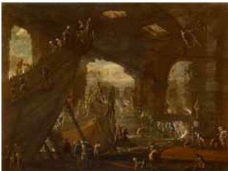
Fig. 23. Agostino Tassi, Arsenale , c. 1639, olio su tela, cm 74x98, 5. Parigi, Galerie Canesso.