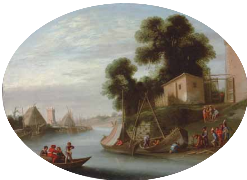
Fig. 9. Agostino Tassi, Paesaggio fluviale con traghetto e cantiere navale , 1612, olio su tavola, cm 29,8x40,7. Londra, Christie's.

Gli affreschi del villino Mergé-Mastrofini a Frascati, solo in parte autografi, non sono del 1615 come ipotizzato in precedenza, ma molto più tardi, probabilmente del 1638, e non sono quindi utili come traccia per le datazioni della seconda decade del Seicento. 23 Un fregio con composizioni analoghe, con edifici visti di scorcio e collocati sulle rive del mare davanti a alberi frondosi, si trova a palazzo Costaguti, e fu quasi certamente