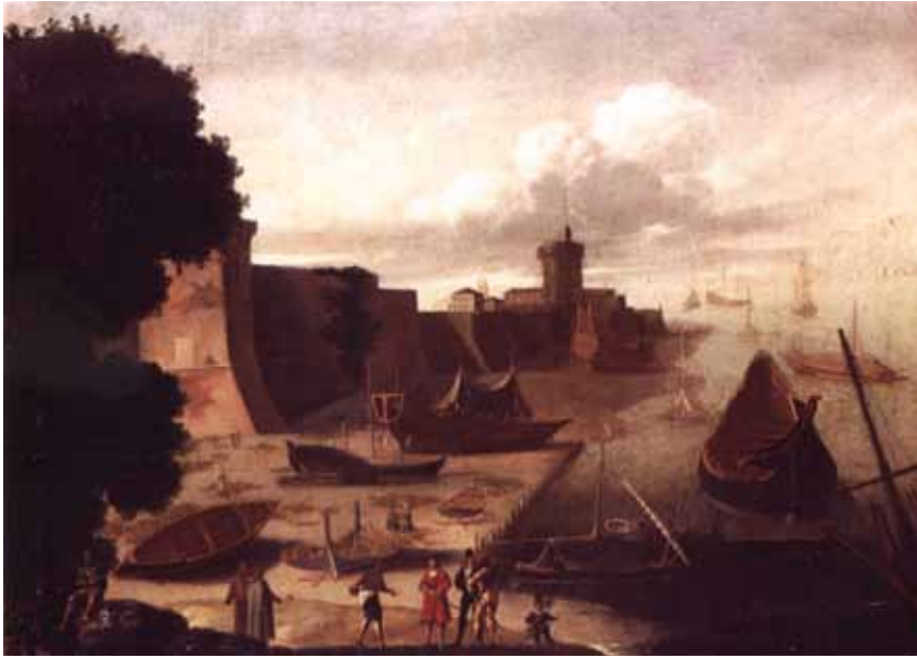
Fig. 1. Agostino Tassi, Scena di porto di Livorno con cantiere e navi in demolizione , 1605, olio su tela. Genova, Museo navale.

Baldinucci dicono fosse allievo. Nel 1605-1606 era a Genova, dove pare abbia lavorato insieme a Ventura Salimbeni, e dove tenne a battesimo un figlio dello scultore fiorentino Francesco Fanelli. 7 Tanto a Genova quanto a Livorno fu impegnato in numerosi lavori di decorazione ad affresco, tutti perduti, ed è perciò molto difficile capire cosa il Tassi abbia dipinto fino a trent'anni e più. Sappiamo che le facciate delle case delle vie principali di Livorno furono affrescate negli anni del soggiorno del pittore, in gran parte con soggetti marinareschi e in particolare di battaglie navali, il che fece sì che egli si specializzasse in questi soggetti, quasi inesistenti nella pittura italiana fino ad allora.