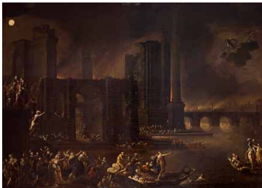
Fig. 21. Agostino Tassi, Incendio di Troia , c. 1637, cm. 97x134. Tolosa, Musée des Augustines.