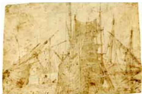
Fig. 4. Agostino Tassi, Cantiere navale , 1609, penna e tempera su carta, mm 213x320. Già Norton Simon Collection.

2-3). Tra i disegni di questo periodo gli sono unanimemente riconosciuti alcune figure di musicanti al British Museum e varie rappresentazioni dell'arsenale di Livorno, di cui una, alla Nationalgalleriet di Oslo, mostra sul verso un'imbarcazione in riparazione. Il retto e il verso di questo foglio sono ricombinati in un piccolo dipinto in collezione privata, che deve però essere stato eseguito in parte da aiuti, in quanto troppo grande è il divario qualitativo con i disegni. 10 Un disegno di un galeone alla Staatliche Graphische Sammlung di Monaco, datato 1609, e giustamente attribuito al Tassi da Marco Chiarini, è quasi identico a uno che si trova all'inizio di un album di Claude Lorrain, che perciò va anch'esso va attribuito al Tassi 11 (Fig. 4). Eseguito in studio con un righello, è comunque ricavato dall'osservazione diretta del galeone, mentre Claude non aveva grande familiarità con le imbarcazioni, anche se le dipinse spesso. Del Tassi dovrebbe essere il dipinto derivato dal disegno, che anch'esso è attribuito in genere a Claude Lorrain (non rintracciato, si trovava in una collezione rumena) 12 (Fig. 5). Nonostante le fonti non abbiano dubbi sul fatto che il Tassi sia stato il maestro del lorenese, i due artisti non sono mai documentati insieme, ma moltissime delle invenzioni di Agostino, in termini di soggetti e composizioni, ricorrono per lungo tempo nell'opera di Claude, ben al di là della fine del suo apprendistato sicuramente terminato entro il 1625. 13