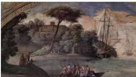
Fig. 13. Agostino Tassi, Scena marina con pescatori , 1623. Roma, Salotto, palazzo Odescalchi.

cisa, ricorda la Negazione di San Pietro (Roma, collezione privata), che è da collocare intorno al 1613. 30 Le figure invece, non più disegnate, ma eseguite con veloci pennellate, sembrano più tarde, della metà degli anni Venti, datazione suggerita anche dai ripetuti tocchi di rosso che il pittore usa più frequente in questo periodo. Non è chiaro dove si svolga la scena, certo non in una prigione come dovrebbe, forse nei sotterranei del palazzo di Erode Antipa.