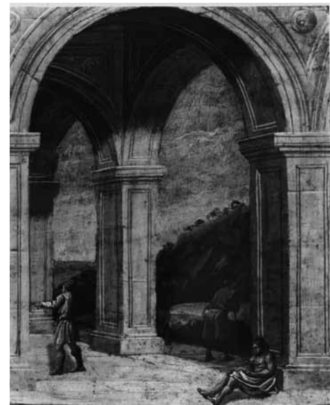
Fig. 3. Agostino Tassi, Veduta architettonica con paesaggio , 1603, olio su pietra, cm 10x8, ubicazione sconosciuta.