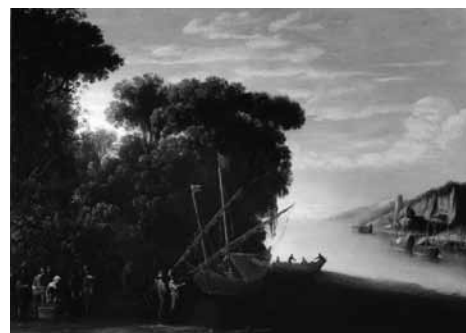
Fig. 7. Agostino Tassi, Paesaggio fluviale con imbarcazioni , 1617, olio su tela, cm 58,5x86. Regno Unito, Già collezione Mrs J. Fielding.

tileschi e successivamente di una rissa, fu esiliato a Bagnaia dall'aprile 1613 fino alla fine del 1615, anni in cui diresse la decorazione di uno dei casini di Villa Lante e forse non ebbe modo di dipingere a olio. In precedenza, nel gennaio del 1612, era agli arresti domiciliari nella dimora di Carlo Saraceni nelle vicinanze di piazza del Popolo. 16 La vicinanza con il pittore veneziano si può forse notare nelle figure dei due tondi su tavola della Galerie Canesso a Parigi (Fig. 6), e ancora in quelle di un bel Paesaggio fluviale con imbarcazioni che si trovava nella collezione Mrs. J. Fielding in Inghilterra, che va datata in prossimità degli affreschi della stanza di San Paolo 17 (Fig. 7). Una Veduta fluviale con la buona ventura in collezione Doria Pamphilj mostra anch'essa figure simili, che ricordano i cinque personaggi di un foglio del Département des art graphiques del Louvre, unanimemente riferito al Tassi (n. 4537); gli va perciò assegnata, confermando la attribuzione al pittore nel catalogo della galleria 18 (Fig. 8). Non troppo distanti cronologicamente dovrebbero essere un piccolo Paesaggio fluviale con tragheto e cantiere navale , su tavola ovale, passato in asta da Christie's