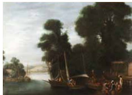
Fig. 10. Agostino Tassi, Paesaggio fluviale con giocatori di morra , 1617, olio su tela, cm 49,5x66. Roma, collezione privata.

Tra i dipinti degli anni Venti apparsi sul mercato negli ultimi anni e ancora inediti, una bellissima scena di naufragio si trova ora in una collezione privata in provincia di Modena (Fig. 15). Per quanto protobarocca nel suo dinamismo esplosivo, la tela non ha la complessità delle composizioni degli anni Trenta, e le pennellate sono ancora attente, descrivono le forme, non le suggeriscono, come accadrà a date più avanzate. Ma il pittore è pieno di contraddizioni, e non è mai facile provare a sistemare i suoi dipinti in un corretto ordine cronologico. Nella Decollazione di San Giovanni Battista (Roma, collezione privata, Fig. 16) la ripetitività delle volte a crociera, rese in maniera impre-