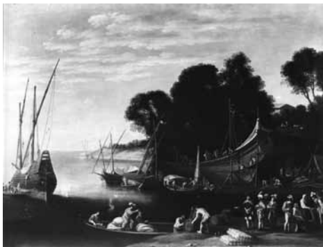
Fig. 8. Agostino Tassi, Veduta fluviale con buona ventura , 1616, olio su tela, cm 80x108. Roma, Galleria Doria Pamphilj.

a Londra nel 2012, (Fig. 9) e una tela rettangolare in collezione privata romana, dove osserviamo in primo piano a destra una minuscola scena di derivazione caravaggesca, con alcuni giocatori di morra dai cappelli piumati che ricordano i personaggi delle taverne dipinte da Bartolomeo Manfredi 19 (Figg. 10-11). Figure di giocatori si ritrovano anche in una Scena di porto un tempo a Parigi nella collezione J. Riechers, e il Tassi avrà derivato l'idea di inserire soggetti caravaggeschi nei suoi paesaggi dal Bril, il quale aveva rappresentato più volte una zingara tra le rovine del foro romano. 20 Le analogie stilistiche della Scena di porto di Parigi con la famosa tela intitolata Gli Argonauti sono state spesso notate, e nonostante la Pugliatti le collochi entrambe nel 1628, sono probabilmente molto precedenti, forse del 1616 o di poco successive. 21 Le svelte figurine di tutti questi dipinti, con le loro pose manierate, ricorrono anche in un foglio con tre musicisti al Victoria & Albert Museum a Londra 22 (Fig. 12).