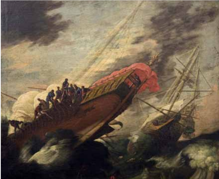
Fig. 15. Agostino Tassi, Navi nella tempesta , c. 1620, olio su tela, cm 64x78. Modena, collezione privata.