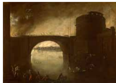
Fig. 22. Agostino Tassi, Fuga da Troia , c. 1639, olio su tela, cm 74,5x98, 5. Parigi, Galerie Canesso.