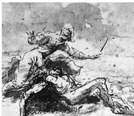
Fig. 17. Salvator Rosa, Ero e Leandro . Londra, Witt Collection

vivere alla mareggiata, può ricondurre ad una committenza medicèa. Come già sottolineato Giovan Carlo de' Medici dovette richiedere al suo pittore le due Marine Pitti in occasione del viaggio per mare verso la Spagna del 1641. Tale traversata si concluse con una sconfitta diplomatica, vista la tiepida accoglienza da parte della corona, e con una rovinosa perdita di equipaggio a causa dell'inadeguatezza dei mezzi con cui le navi fiorentine, armate dagli spagnoli, dovettero affrontare le burrasche. Un'esperienza che spinse probabilmente il principe a cercare, da allora, una vita defilata dalla politica e tutta dedita alle arti 39 .