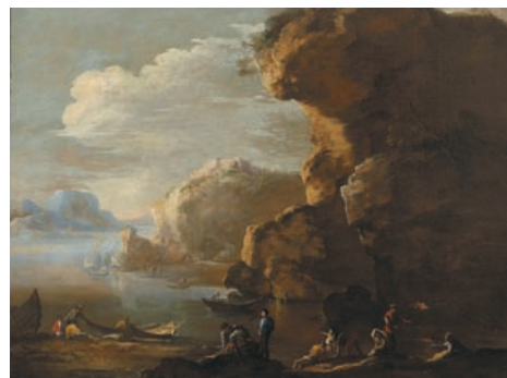
Fig. 1. Salvator Rosa, Marina . Già Napoli, Galleria Napoli Nobilissima