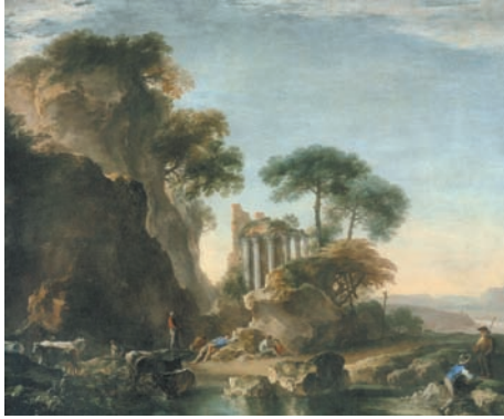
Fig. 7. Salvator Rosa, Paesaggio con contadini . Cleveland, Museum of Fine Arts