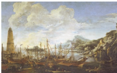
Fig. 12. Claude Lorrain, Marina del Faro . Firenze, Palazzo Pitti

L' Erminia che incide il nome di Tancredi sul tronco di una quercia (fig. 11) è uno dei capolavori del periodo giovanile di Salvatore, un dipinto che mostra la piena padronanza dello spazio e dell'impaginazione paesaggistica, segnalando la conquista da parte del Rosa di uno stile nuovo maturato a fianco di Swanevelt, Lorrain e soprattutto Gaspar Dughet 33 . Fondato sulle premesse della pittura di genere romana, praticata a diverso titolo da Jan Miel, Jan Both, Michelangelo Cerquozzi, e dagli stessi Dughet e Swanevelt, il paesaggio di Salvatore acquista ora un nuovo respiro che conferisce alle sue opere una monumentalità sconosciuta ai bamboccianti. La campagna romana intorno al letto del Tevere, con i suoi boschi, la sua terra rossiccia e i promontori vicino al mare, è descritta nel dipinto di Modena tramite il ricorso ad una tavolozza ricca di sfumature sui bruni e sui verdi, mediante studiati contrasti di chiari e di scuri, di quinte arboree e di orizzonti sfumati, come notò tra i primi l'agente del duca di Modena. Al suo confronto l' Erminia tra i pastori dello Swanevelt, identificabile seppur con qualche cautela con uno dei quadri compagni inviati insieme a Modena, risulta opera assai più debole, monotona, irrisolta sul piano della composizione come delle figure, allineata alle opere