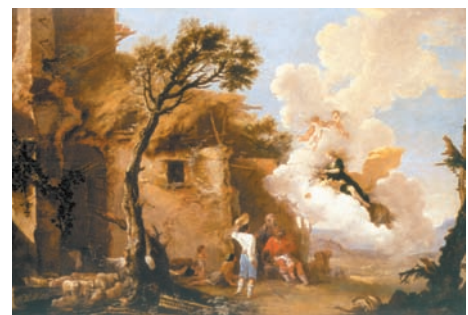
Fig. 14. Salvator Rosa, Il Ritorno di Astrea . Vienna, Kunsthistorisches Museum