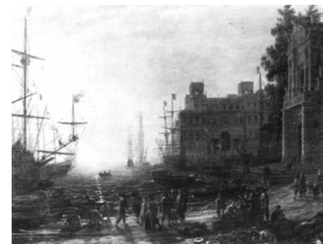
Fig. 6. Claude Lorrain, Paesaggio al tramonto con Villa Medici su un porto . Firenze, Uffizi