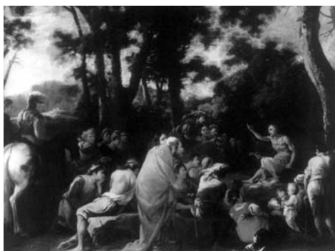
Fig. 4. Salvator Rosa, Predica del Battista . Già Londra, Christie's, 1991

Quadro di notevoli dimensioni e di grande impegno prodotto da Salvatore con buona probabilità negli anni a cavallo tra l'ultimo periodo napoletano ed il breve passaggio romano, ovvero tra il 1638 ed il 1639, la Marina venne commissionata per far parte del ciclo di paesaggi del Buen Retiro, insieme alle vedute di Herman van Swanevelt,