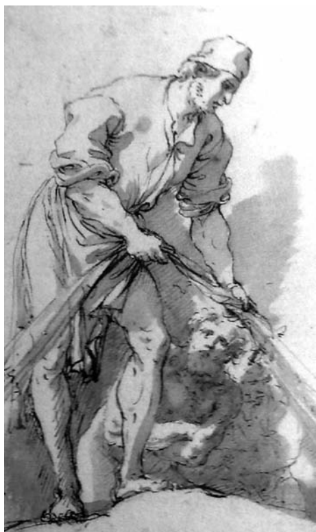
Fig. 15. Salvator Rosa, Pescatore e bagnante . Haarlem, Teylers Museum