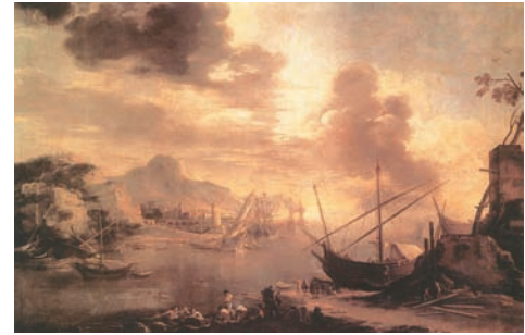
Fig. 5. Salvator Rosa, Marina . Museo del Prado