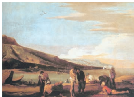
Fig. 2. Salvator Rosa, Pescatori di corallo . Columbia (SC, USA) Museum of Art, gift of Samuel H. Cress Foundation