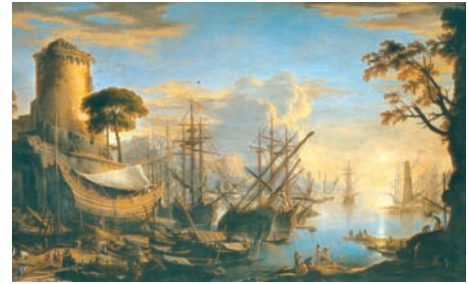
Fig. 13. Salvator Rosa, Marina con arsenale . Firenze, Palazzo Pitti

Segnali di un veloce adeguamento ai modi della pittura fiorentina, fatta di un disegno più netto e di colori limpidi, ed anche di una sen-