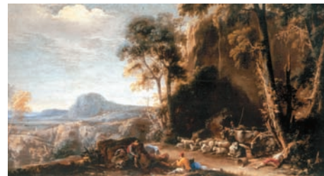
Fig. 9. Salvator Rosa, Paesaggio con armenti e pastori . Londra, Sotheby's, 2004

Grazie agli uffici dell'abate Musso frequentatore degli ambienti artistici di Piazza del Popolo, come si diceva, il principe ottenne una