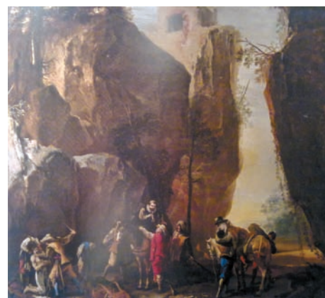
Fig. 10. Salvator Rosa, Paesaggio con banditi . Kent (GB) Knolle House