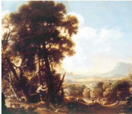
Fig. 11. Salvator Rosa, Erminia incide il nome di Tancredi su un albero . Modena, Galleria Estense