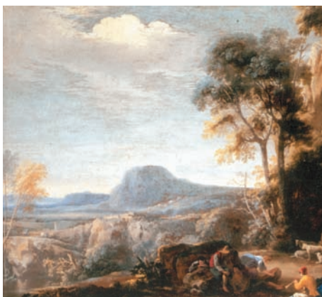
Fig. 8. Salvator Rosa, Paesaggio con armenti e pastori (part.). Londra, Sotheby's, 2004

Qui il pittore partenopeo ebbe modo di familiarizzare, vuoi in occasione delle commedie recitate per il Carnevale, vuoi tramite i mercanti o lo stesso Hermann Swanevelt, con alcuni dei cosiddetti bamboccianti, artisti legati alla corrente pittorica del Van Lear spesso oggi confusi tra loro ma dietro il cui termine generico si nascondono personalità a volte davvero grandi, come quella di Michelangelo Cerquozzi, di Jahn Both e di Viviano Codazzi. Con quest'ultimo il Rosa aveva avuto modo di collaborare a Napoli, e certo anche con il Both l'artista si doveva essere già incontrato nel corso del primo soggiorno romano, intorno al 1635, se certi volti leggermente caricaturali, come spiritati del pittore olandese, e alcuni virtuosismi pittorici come l'uso