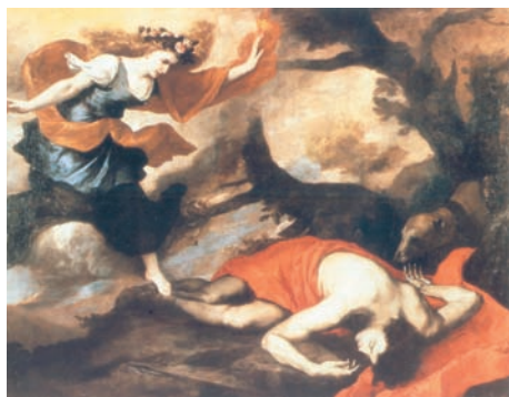
Fig. 18. Jusepe de Ribera, Venere e Adone . Roma, Galleria Nazionale d'Arte Antica Palazzo Corsini

Vicino per stile e impostazione, nel suo caratteristico calibrare insieme scena popolare ed episodio mitologico, all' Astrea di Vienna, ma anche alle lunette della Muletta per quel timido concedersi alle novità barocche orecchiate a Firenze nei ponteggi con Pietro da Cortona, il quadro mostra i colori freddi e il cielo striato del Ritratto di filosofo della National Gallery di Londra, datato al 1641. Le figure di bagnanti e pescatori costituiscono la versione ancor più riuscita, se possibile, delle figure in primo piano della grande Marina Pitti , con il tipico giovane infreddolito o la figura semidistesa, in camicia e senza brache, che è ancora ricordo della giovanile e falconiana Pesca del Corallo . Il gruppo centrale invece, così solenne e composto, non può non richiamare alla memoria Tobia benedice la sepoltura degli ebrei di Andrea de' Lione oggi a New York, Metropolitan Museum. La figura di Ero infine, con quel suo gesto danzante, sebbene ancora memore delle Veneri di Jusepe de Ribera 42 è già a metà strada tra l'Erminia del dipinto per Modena e la Siringa del tenebroso quadro per Francesco Corsini (fig. 14).