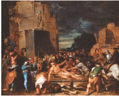
Fig. 3. Salvator Rosa, Martirio di San Lorenzo . Avellino, Banca della Campania

del Seicento, e che i due cognati si siano in tal modo ritrovati, ancora giovani, a condividere gli insegnamenti del grande artista spagnolo. Tracce del magistero di Ribera, e ancor più direttamente dell'apprendistato presso la bottega popolosa di Aniello Falcone, sono rintracciabili in numerose opere del periodo giovanile recentemente ascritte al Rosa.