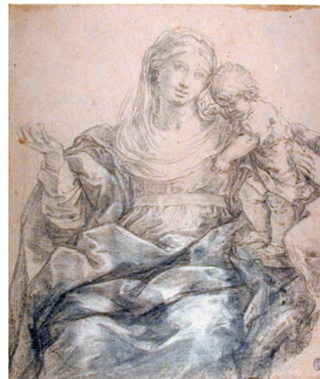
Fig. 12. Guido Reni, Madonna e Bambino . Oxford, Ashmolean Museum

Coerente in tal senso per il trattamento grafico e inoltre la bellissima ombreggiatura nello Studio per la Madonna dei Tanari al Fitzwilliam Museum di Cambridge, per il perduto dipinto del 1630 circa. 30 I bagliori, che a volte realizzano un motivo zigzagato sul