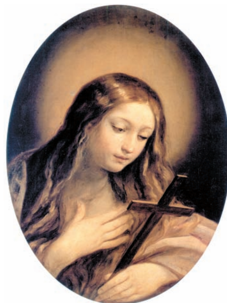
Fig. 16. Guido Reni, Maddalena penitente . Roma, Pinacoteca Capitolina