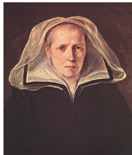
Fig. 1. Guido Reni, Ritratto della madre dell'artista , Ginevra Pozzi. Bologna, Pinacoteca Nazionale

Sembrirebbe che il suo rapporto con le donne – ovviamente ad