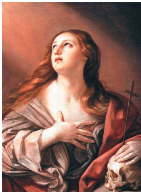
Fig. 2. Guido Reni, Maddalena penitente . Baltimora, Walters Art Museum