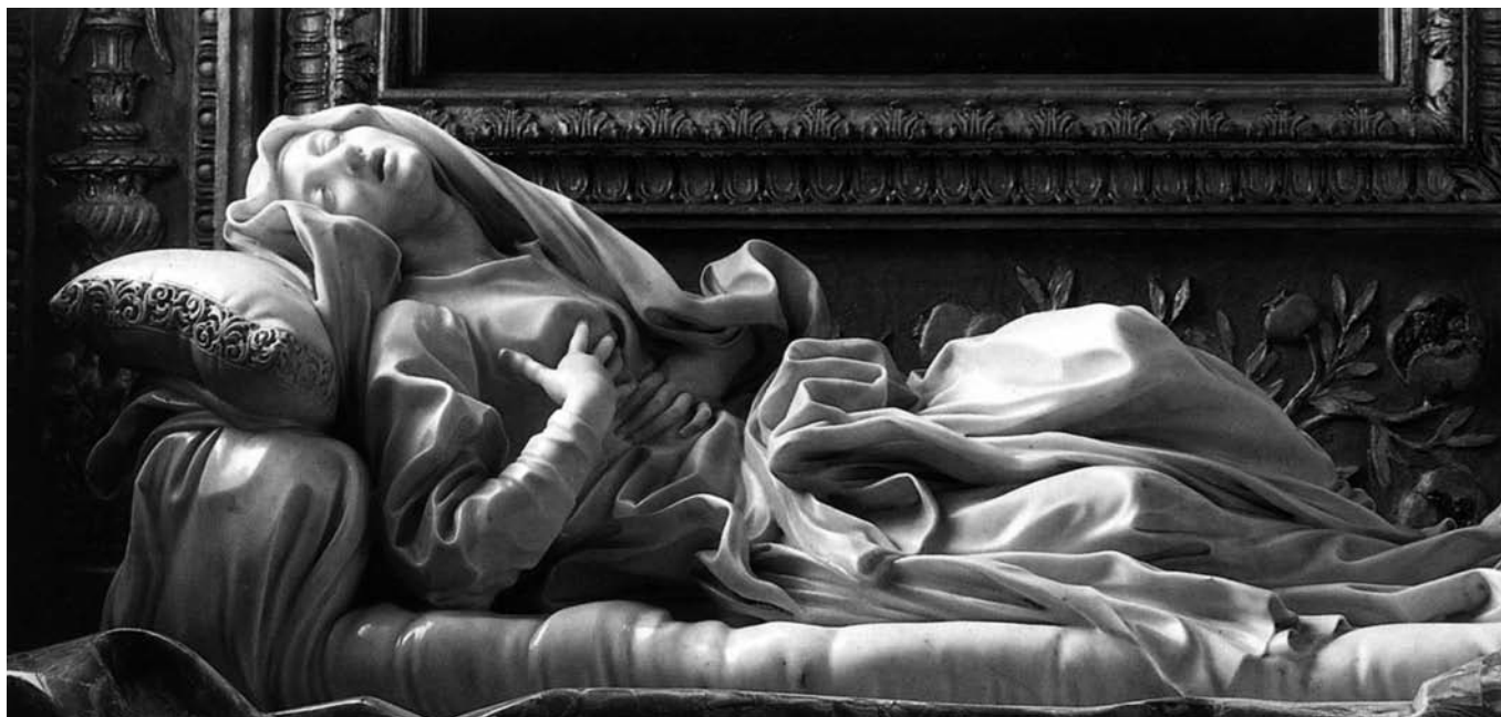
Fig. 9. Giovan Lorenzo Bernini, La beata Ludovica Albertoni . Roma, San Francesco a Ripa, Cappella Altieri

comune rappresentazione della santa che indossa la corona di spine di Cristo. Le spine acuminatae di questa copricapo sono concepite in maniera marcatamente somigliante, nonostante il dipinto di Tiepolo sia più grande e più incombente di quella di Reni.