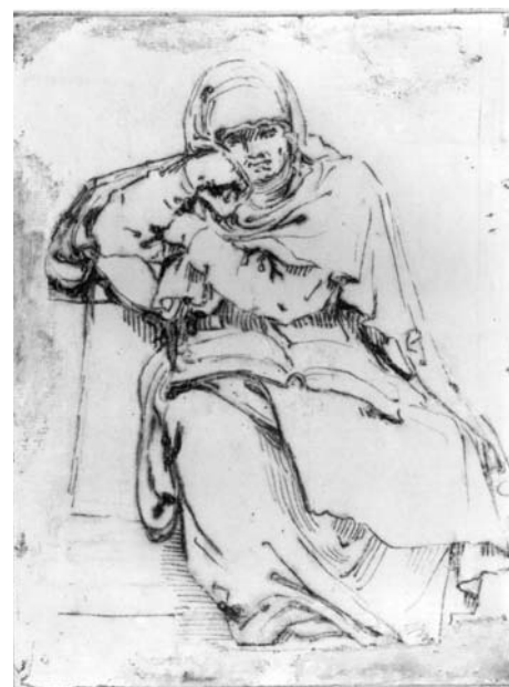
Fig. 13. Guido Reni, Sibilla seduta . Windsor Castle, Royal Library