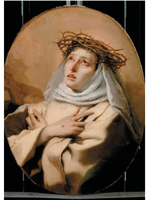
Fig. 10. Giovanni Battista Tiepolo, Santa Caterina da Siena . Vienna, Kunsthistorisches Museum

Forse il passaggio pittorico più semplificato ed eseguito con maggiore spontaneità nell’intero dipinto si trova nella manica sinistra, dotata di pieghe sommarie, spigolose, che terminano nella piccola mano delicata che sorregge il giglio, realizzato magnificamente. Il trattamento della manica è tanto astratto da farla sembrare dipinta secoli dopo. Interessante è il triangolo scuro sotto la tonaca color crema, proprio sul braccio, sopra la curva del gomito, forse indica-