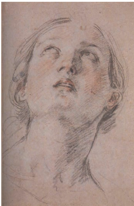
Fig. 15. Guido Reni, Studio per la testa di Giuditta . Già Holkham Hall, Norfolk

panneggio, qui contrastano fortemente i mezzi toni. Il trattamento enfatico si rispecchia nei sicuri colpi di pennello della Santa Caterina da Siena .