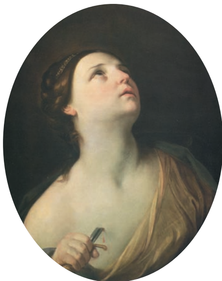
Fig. 3. Guido Reni, Lucrezia . Bologna, Collezione Roberto Lauro

eccezione di quello con la madre - fosse altrettanto curioso. Stando alle moderne interpretazioni psicologiche del lavoro di Guido, il celebre Atalanta e Ippomene del 1618 - 19, (Fig. 4) al Prado 9 (ve n'è una seconda versione a Capodimonte, Napoli) 10 sarebbe una prova della sua ostilità nei confronti dell'altro sesso. La gestualità di Ippomene verso Atlanta, per certi versi bizzarra, sarebbe secondo questa ipotesi riflesso di un rigetto, come se egli provasse repulsione alla vista della prosperosa donna svestita innanzi a sè.