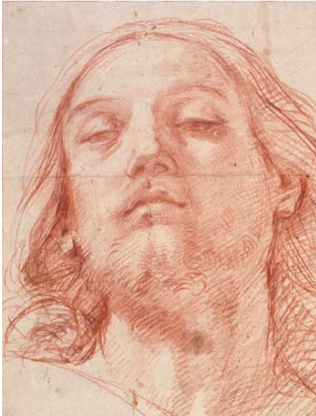
Fig. 14. Guido Reni, Studio per la testa di Cristo . Windsor Castle, Royal Library