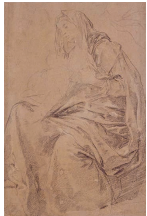
Fig. 11. Guido Reni, Studio per la Madonna Tanari . Cambridge, Fitzwilliam Museum